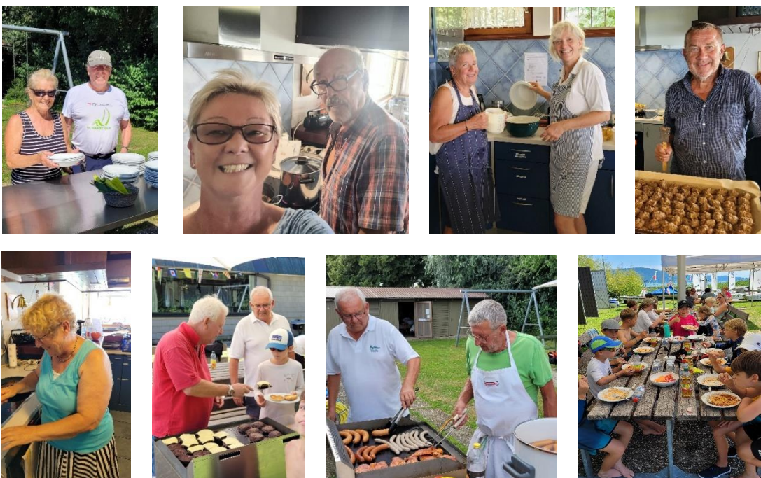
Die kulinarischen Verwöhner/innen mit Freude bei der Arbeit