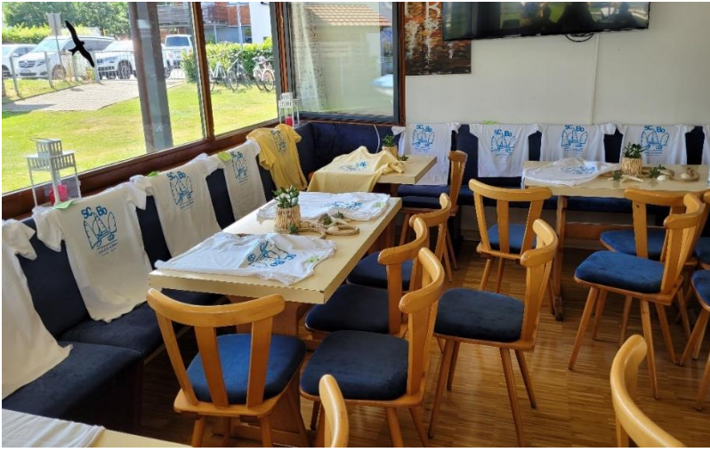
Das Clubhaus reichte kaum aus, um die zahlreichen Shirts nach dem Druck trocknen zu lassen.

Am letzten Trainingstag wurde der „Jüngstenschein“ abgenommen. Die Voraussetzungen hierfür ist die regelmäßige Teilnahme über ein Jahr am Training beim SCBo in Theorie und Praxis.