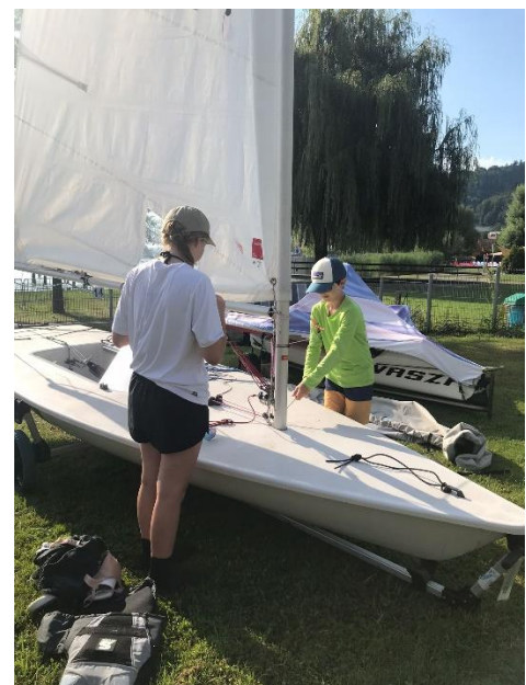
Hochkonzentriert beim Aufbau...